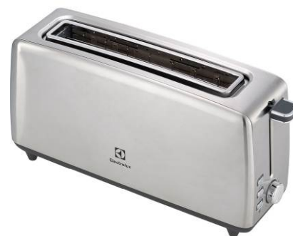
Echec du grille-pain

En pénétrant dans l'Hôtel Gaillard nous irons de surprise en surprise.